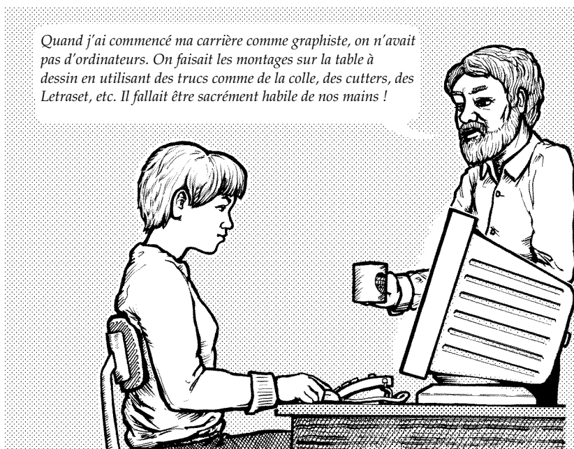
FIGURE 2 – Graphiste au travail (1995) — dessin de l'auteur

générique à l'aide de « catalogues » de paragraphes et de caractères — et l'approche du balisage générique faite par SGML.