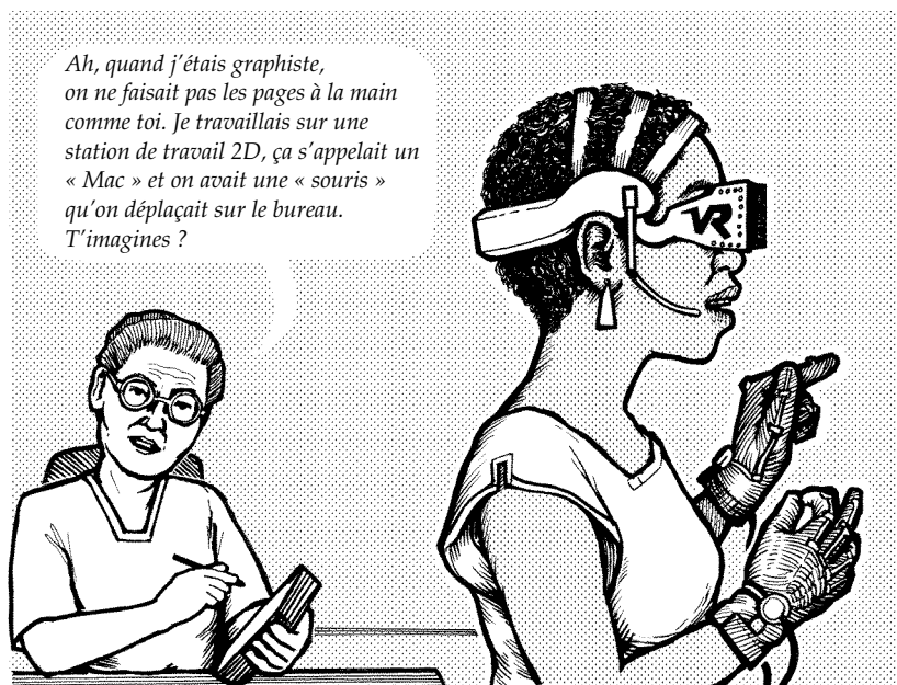
FIGURE 3 – Graphiste au travail (2010?) — dessin de l'auteur

Les logiciels WYSIWYG tiennent bien leurs promesses, surtout pour ceux qui apportent toute la gamme de leurs compétences langagières et artistiques. Si vous êtes à la fois graphiste et compositeur, et que ce que vous voyez à l'écran ne correspond pas avec votre sens graphique, vous pouvez effectuer des changements pour y remédier. Si vous avez aussi des pouvoirs de rédacteur-en-chef et qu'un mauvais saut de page ou de ligne donne un résultat typographique inacceptable, vous pouvez modifier le texte jusqu'à obtenir le bon résultat. Vous pouvez me croire, c'est ce que je fais pour chaque page de chaque manuel pédagogique que je compose.